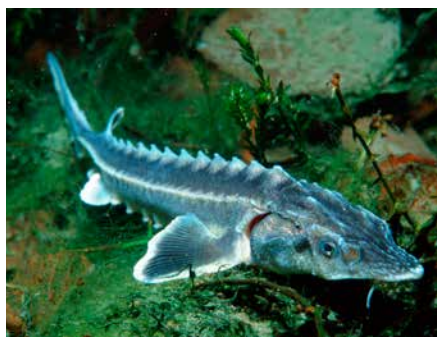
Prirodna poplavna područja potrebna su kako bi zaštitili iznimne vrste poput orla štekavca te prirodne očuvane rijeke bez brana kako bi zaštitili jesetre