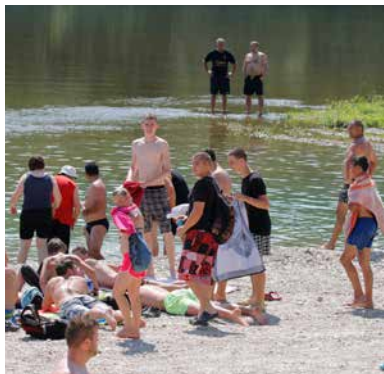
Prirodne rijeke lokalnom stanovništvu nude prostor za opuštanje i temelj su eko turizma