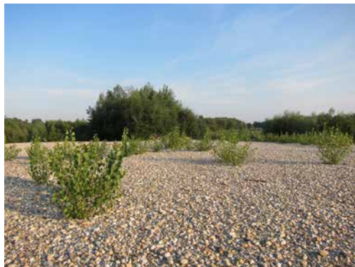
Na novonastalim sprudovima prirodnih rijeka rastu pionirske biljne vrste