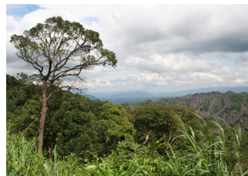
Neodrživa berba ratana dovodi do propadanja šuma i utječe na ukupne usluge šumskih ekosistema u Vijetnamu

Ekosistemi omogućavaju život održavajući sveukupnu ravnotežu u prirodi. Kada dobro funkcionišu, ekosistemi pružaju mnogostruke koristi ljudima. Ove koristi su širokog opsega - od obezbeđivanja osnovnih dobara, kao što su hrana, voda i gorivo, do duhovnih koristi, kao što su estetski lepi predeli u kojima svi uživaju. Međutim, briga o životnoj sredini i plaćanje za usluge ekosistema nije samo odgovornost privatnog sektora. Vlade, lokalne zajednice i NVO takođe nose deo odgovornosti zaštite životne sredine.