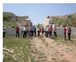
U NP Krka sudionici su posjetili vojni logor Burnum

Dvadeset predstavnika nevladina, ali i državnog sektora iz Srbije i iz Crne Gore krajem maja provelo je tri dana u Hrvatskoj slušajući o pripremama za Natura 2000 zemlje koja je regiji najbliža ulasku u EU. Trodnevni boravak u Zadru, tijekom kojega su slušali o političkim pripremama, ali i o dobrim, odnosno lošim iskustvima, zaokružen je izletom u NP Krka.