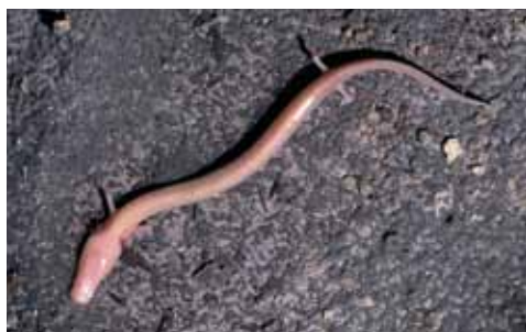
ЧОВЕЧКА РИБКА ( PROTEUS NAGUIBUS)(PROTEUS ANGUINUS)

Со помош на веб страна, брошури и разни комуникациски помагала дури и со голема рекламна кампања. ќе настојуваме да се направи бренд од Парковите на Динарската верига кој во регионот но и пошироко да биде препознатлив до 2015 година. Ќе развиеме соработка со соодветните министерства и туристичките агенции со цел да се пронајде начин како да најдобро да се промовира брендот Паркови на Динарската верига.