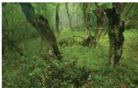
ГОРНО ПОДУНАВЈЕ, СРБИЈА