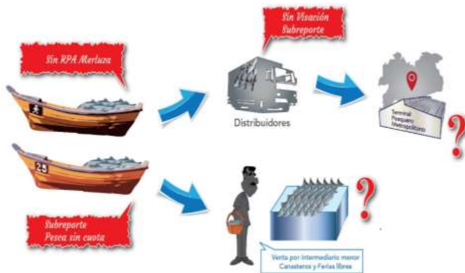
Figura 3: Cadena de Pesca-INN de la pesca artesanal, incorporando la ilegalidad en que incurren los comerciantes y distribuidores del recurso.

Los intermediarios pueden estar dentro o fuera del sector artesanal. Algunos de éstos son pescadores que ya no se dedican a la pesca propiamente tal y se han hecho cargo de la comercialización. Los comerciantes son los que regulan el precio playa y la demanda por un mayor volumen de extracción. En este sentido, la existencia de Pesca-INN está fuertemente influenciada por la presión que ejercen los comerciantes, actores que asumen roles proteccionistas y subsidiarios con los pescadores, los que a su vez les retribuyen con el abastecimiento de capturas. En definitiva, esto constituye un círculo de protección de la ilegalidad.