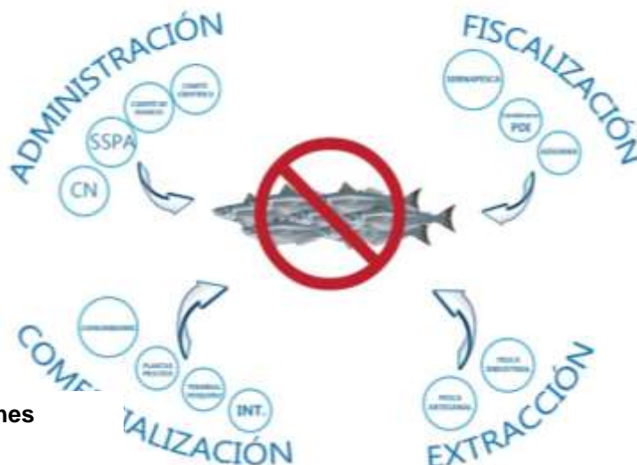
Figura 1: Principales instituciones relacionadas con la Pesca-INN.

Al realizar una revisión de la prensa nacional respecto a la Pesca-INN de merluza común, la mayor cantidad de noticias hacen referencia a incautaciones realizadas a camiones que transportaban pescado sin acreditación de origen legal o simplemente sin documentación.