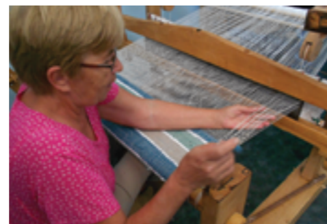
Tradicionalno tkanje tepiha

Terenski projekt Una sadrži sljedeće aktivnosti: