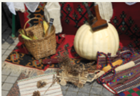
Tradicionalni proizvodi