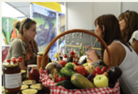
Eko tržnica

Na području Nacionalnog parka Una radi se na razvoju zelenog poslovanja i brendiranju lokalnih proizvoda.