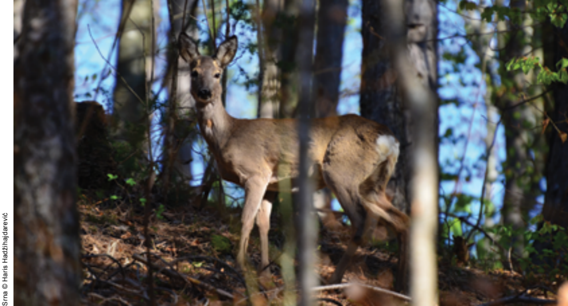
Srna © Heiris Hadžihajdarević