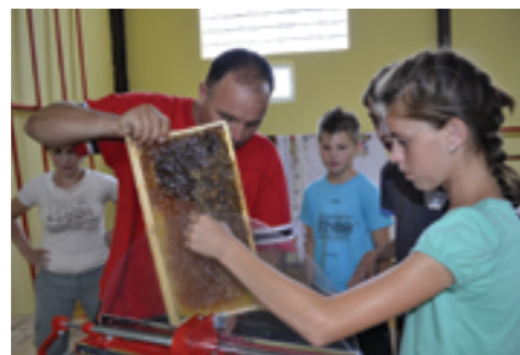
Proizvodnja meda

Kako bi stanovnici područja mogli iskoristiti mogućnosti koje donosi turizam, posljednjih je godina WWF poticao bolju suradnju između uprave Nacionalnog parka Una i lokalne zajednice, malih poduzeća i drugih zainteresiranih strana. Za nastavak podrške sada potičemo ljude koji žive u parku ili oko njega da pokrenu i razviju mala poduzeća u sektoru turizma na financijski, ekološki i socijalno održiv način.